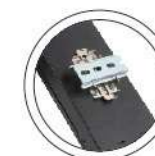
Instalación tipo rail universal